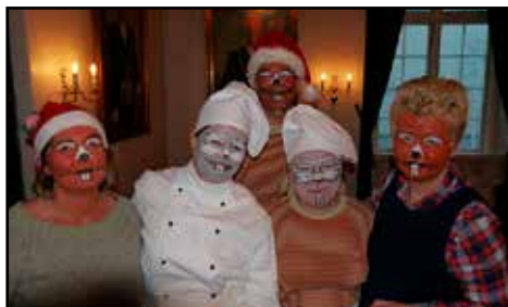
Bildetekst inn her

I jubileumsåret har korpset rundt 60 aktive musikanter i sine rekker. Jubilanten har ingen besetningsproblemer i øyeblikket, men gjennomsnittsalderen er høy og rekrutteringen kunne ha vært bedre. Disse utfordringene har imidlertid korpset hatt i 100 år nå, så vi kan vel si at vi har funnet vår måte å løse slike utfordringer på.