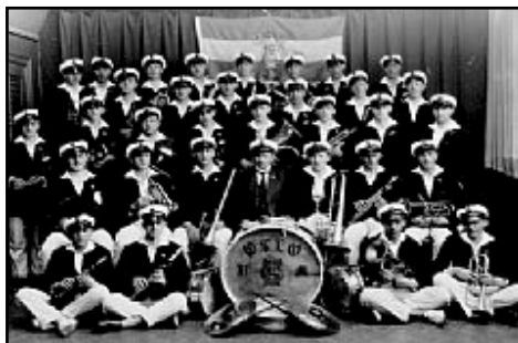
Bildetekst inn her

Kanskje det var denne begeistring som gjorde så stort inntrykk på guttene, at de seinere på høsten, nærmere bestemt 1.september 1919, lot seg inspirert til å stifte Kristiania Ungdoms-musikkorps. Stiftelsesmøtet fant sted på Kampen skole der også øvelsene ble avholdt. Eller kanskje det bare var drømmen om å drive med musikk og ungdommelig virketrang som resulterte i opprettelsen av korpset. Rockeband hadde ingen naturlig nok hørt om og elektriske instrumenter fantes ikke, så for ungdom som ønsket å lage «band», var det ikke unaturlig å starte et musikkorps. At disse guttene skulle være blant de første til å gjøre dette i hovedstaden, gjør dem til pionerer i denne sammenheng og til forbilder for andre unggutter