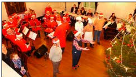
Bildetekst inn her

hadde dukket opp og det falt mange tungt for brystet. Det var åpnet opp for jenter i mange skolekorps eller det var etablert egne skolekorps for jenter, men i amatørkorpse hang man etter. På tross av utfordringer med rekruttering og trussel om nedleggelse, satt det langt inne å åpne opp for jentene. Møtereferater hvor dette ble diskutert er lystig lesning, men for dem som deltok i diskusjonen var nok dette blodig alvor. Flere truet med å slutte i korpset og mange var redde for at korpset på sikt ville bli nedlagt dersom man åpnet opp for jenter. Jentene som var blitt for gamle for skolekorpse banket imidlertid bokstavelig talt på døra og ville inn. Flertallet som vant fram var heldigvis å åpne døra for dem.