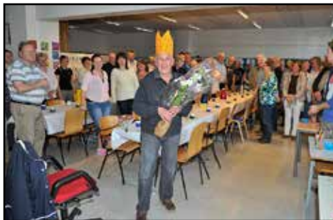
Bildetekst inn her

løsningen på problemene med rekruttering og mangelfull instrumentbesetning. Den løsningen har korpset seinere fulgt hver gang vi har fått alvorlige problemer med besetningen. Dersom framtidige medlemmer av korpset følger oppskriften, vil byens eldste amatørkorps være sikret langt inn i framtiden. Løsningen innebærer å fusjonere med et annet korps.