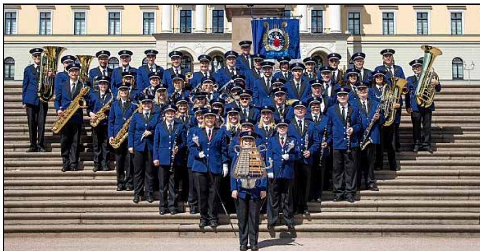
Bildetekst inn her

Det er også rart å tenke på at det var verdenshendelser i forbindelse med første verdenskrig som skulle bli avgjørende for at Oslo Janitsjar så dagens lys. Krigen førte til at det var mangel på metall til å lage instrumenter av, for alt gikk med til våpen og krigsmateriell. Dette faktum gjorde det umulig å rekruttere nye medlemmer til byens